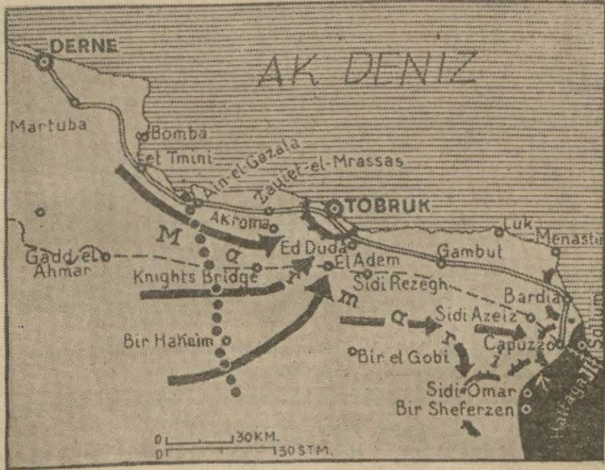
Libyada harb sahalarını gösterir harita

General Odicin halen Amerika-da bulunduğu söylenmektedir. Ge-neral, aynı zamanda askeri rüt-be-sinden mahrumiyete ve sahib bulduğ-u ve bulacağı emlakın müsaderesine de mahkûm olmu-s-tur.